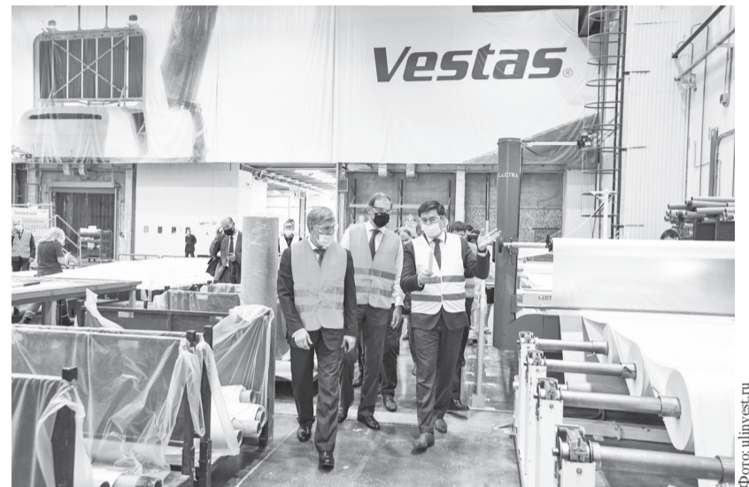
Финская компания «Вестас» вернула в бюджет региона 392 миллиона рублей, которые ее обязал выплатить суд за одностороннее расторжение специального инвестиционного контракта, заключенного с Ульяновской областью и Минпромторгом РФ.

Из дополнительных средств на формирование благоприятного инвестиционного климата отправят 12,9 миллиона рублей. На строительство ФАП в селе Уржумское в